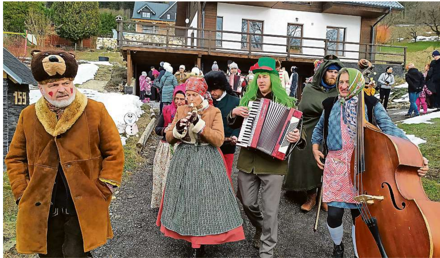
Masopust Průvod masek zažila i Proseč pod Ještědem. Masopustní veselí bude v kraji pokračovat také příští víkend.

PROSEČ POD JEŠTĚDEM Medvěd, dráb, smrtka, cikánka, Žid, komíník, Slaměný, bába s nuší. Tradiční masopustní masky se o víkend objevily na řadě míst v Libereckém kraji. Od masopustního veselí je přitom neodradil ani silný vítr, který trápil region hlavně v sobotu. S muzikou a zpěvem žila například Proseč pod Ještědem díky folklornímu souboru Horačky.